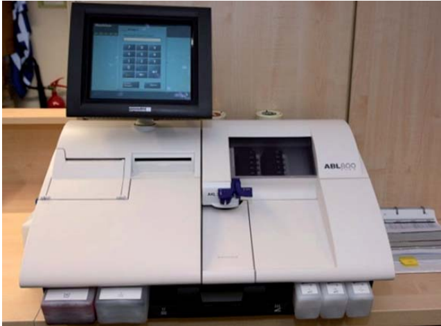
Figura 2. Gasómetro modelo ABL Flex 800 (Radiometer, Copenhagen, Denmark).