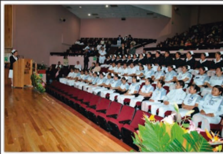
Primera ceremonia del paso de la luz