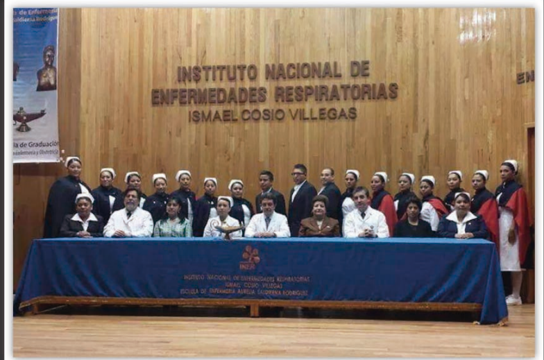
Autoridades de la Dirección de Enseñanza