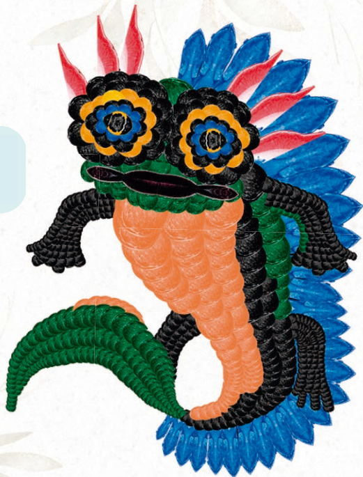
Ilustración realizada a base de mastografías