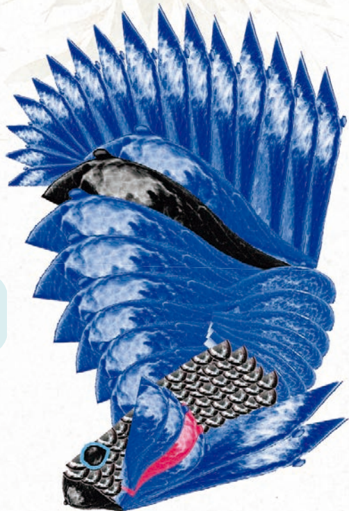
Ilustración realizada a base de mastografías