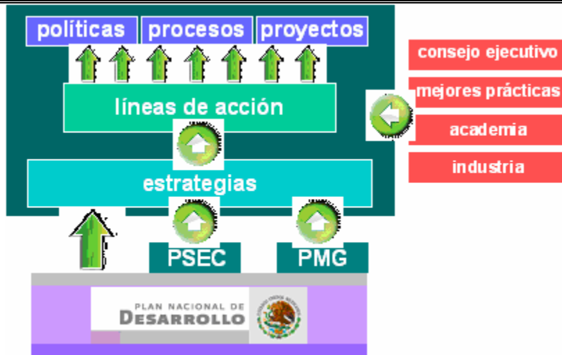
Figura 7.1 Estrategia de Gobierno Digital

El desarrollo del Gobierno Digital, en esta primera etapa, está basado en siete estrategias, cada una de ellas contiene líneas de acción específicas que serán utilizadas para la planeación táctica del Gobierno Digital en el periodo 2008-2012. Para identificar el avance de las estrategias, cada línea de acción deberá traducirse en políticas, procesos (sistemas) y proyectos que serán planeados y ejecutados por las dependencias y entidades de la APF con el liderazgo de sus áreas de TIC. Para este efecto, las siete estrategias se han desarrollado en el contexto de la cuantificación del valor público que aportan las TIC, la cual considera dos grandes áreas de impacto: eficiencia operativa gubernamental y servicio al ciudadano.