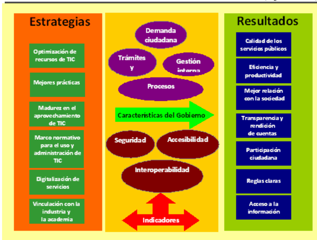
Figura 8.1 Modelo de Evaluación de Gobierno Digital *

* Basado en el Modelo multi-dimensional de medición de gobierno electrónico para América Latina y el Caribe, Mayo 2007, Naciones Unidas, CEPAL y otros, por José Ramón Gil-García, Luis Felipe Luna Reyes y Hernán Moreno Escobar. http://www.cepal.org/Socinfo