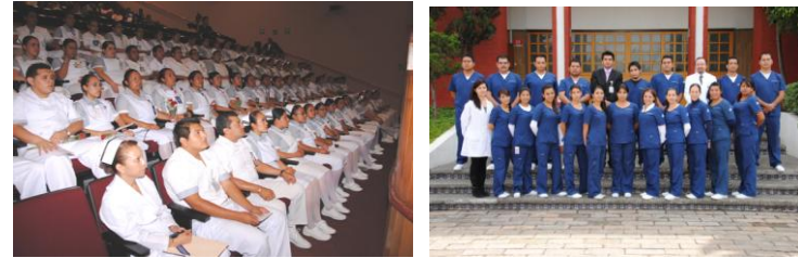
Acervo de las Escuelas de Enfermería y de Terapia Respiratoria, 2012

El objetivo del Departamento de Formación en Pregrado es contribuir en la formación de recursos humanos de alta calidad a través de campos clínicos para la realización de prácticas profesionales, servicio social para estudiantes de licenciatura, técnicos, y paramédico que se llevan a cabo en el Instituto, mediante convenios con diversas instituciones educativas de reconocimiento nacional e internacional, como la U.N.A.M., IPN, CONALEP, U.A. de Sinaloa, U.A. de San Luis Potosí, U.A.M., S.E.P., IMSS, Escuela Superior de Terapia Física, C.R.I.T., entre otras; así como diversas instituciones privadas del país como la Universidad la Salle, la Universidad Panamericana, la U.N.I.TEC, la Universidad Latinoamericana, Universidad Interamericana, Universidad Justo Sierra, Universidad Iberoamericana y Universidad Anáhuac.