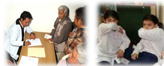
Congreso de Trabajo Social, 2009.

Se brindan estas actividades para los pacientes, familiares y público en general interesados en el conocimiento de enfermedades respiratorias, su control y prevención. Se realizan cursos, talleres y pláticas durante todo el año. Así mismo el personal de Trabajo Social en cada Servicio Clínico, puede brindarle información básica por escrito.