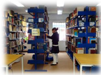
BIBLIOTECA DEL INER