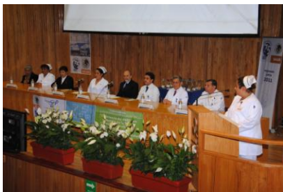
Jornadas de Enfermería, 2011.