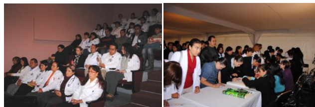
Jornadas Médicas 2011.

Estos eventos presenciales se presentan en sus diferentes modalidades: cursos, curso-taller, simposia, pláticas y conferencias, que van dirigidos a médicos generales, especialistas, investigadores, psicólogos, trabajadores sociales, técnicos paramédicos, y ramas afines al tema. Algunos eventos podrá recibirlos vía internet, para lo cual le pedimos contactar al personal del Depto. Educación Continua.