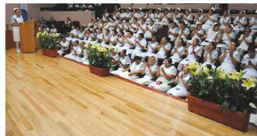
Archivo de Escuela de Enfermería 2012